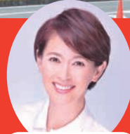
スペシャルゲスト 有森裕子さん